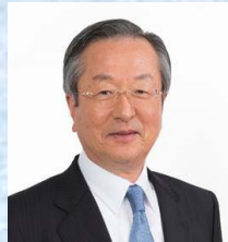
(一社)新潟県経営者協会 並木会長